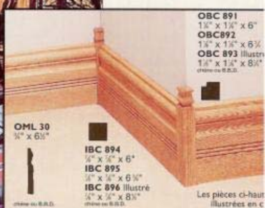
OML 30 1/2" x 6 1/2"