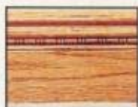
763 1/4" x 6" chêne ou B.B.D.