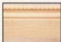
1035 3/8" x 4 1/2" chêne ou B.B.D.