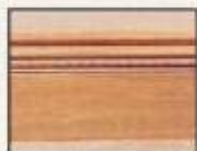
765 1/2" x 5" chêne ou B.B.D.