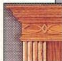
Pièce encastrée queue de poisson