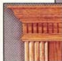
Pièce encastrée dentelée