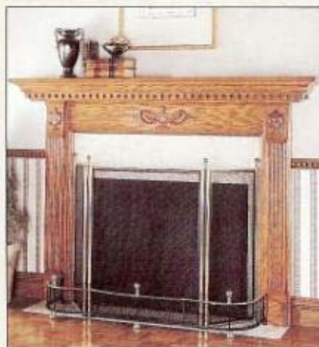
Illustré ci-dessus, en chêne : Manteau de cheminée Dentelé, Ensemble d'encadrement de base, Ensemble de pilastre classique, Ensemble d'applique urne décorative.