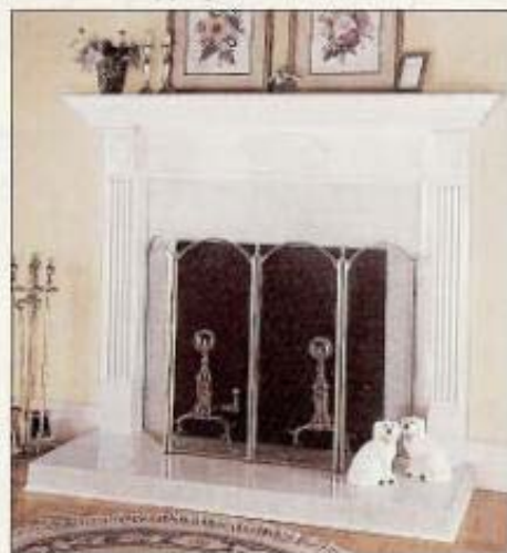
Une touche d'élégance classique! Le manteau de cheminée Héritage et l'encadrement de base sont rehaussés à l'aide de l'ensemble de pilastre et de l'ensemble d'applique rosette.