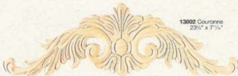
13802 Couronne 23 1/2" x 7 1/4"