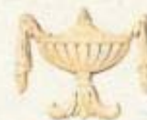
3088 4 1/2" x 4"