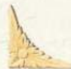
3087 2 1/2" x 4 1/4"