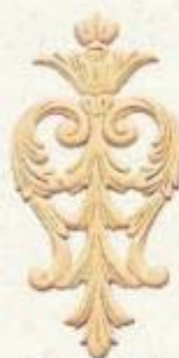
3011 4 1/2" x 9 1/2"