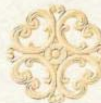
3202 5 1/2" x 5 1/2"