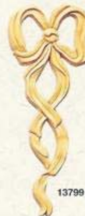
13799 Noeud vertical 5 1/2" x 13 1/4"