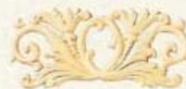
3069 8 1/2" x 3 1/2"