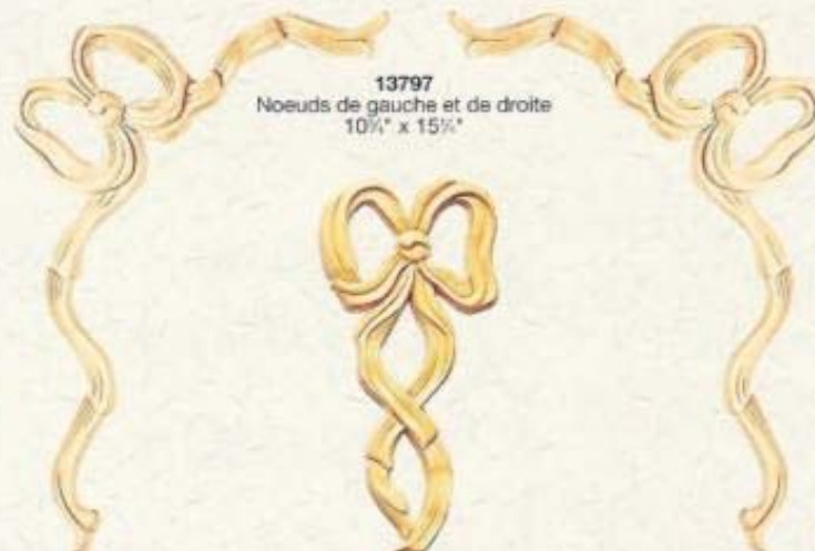
13797 Noeuds de gauche et de droite 10 1/2" x 15 1/2"