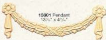
13801 Pendant 13 1/4" x 4 1/4"